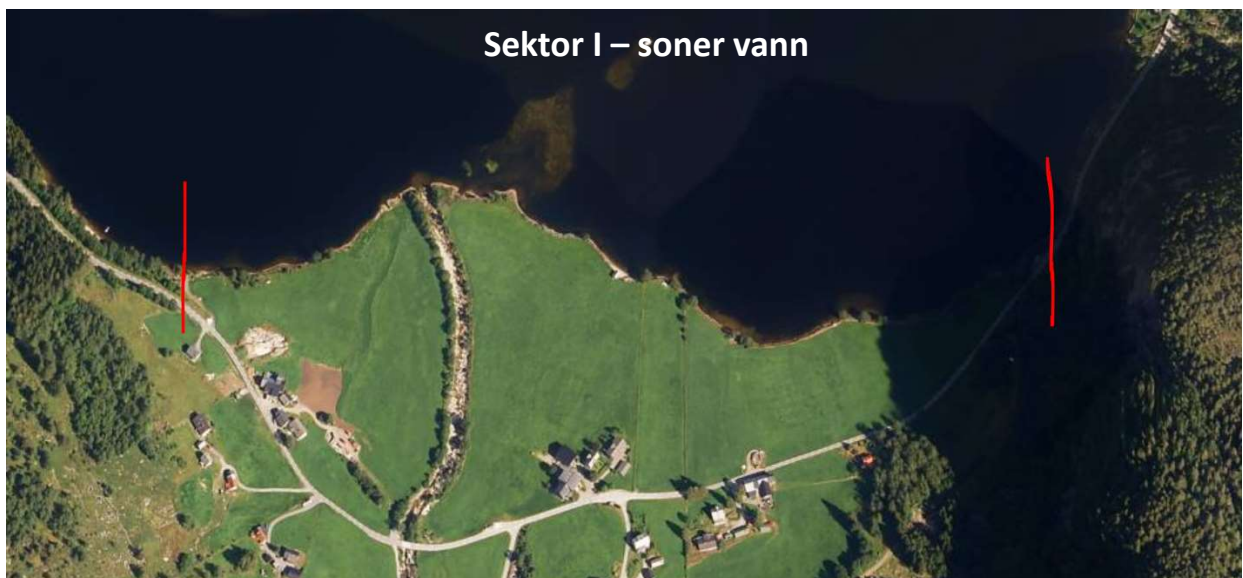
Sektor I – soner vann